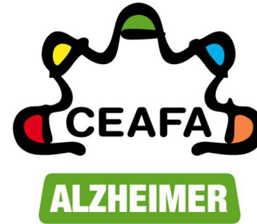
IMAGEN CORPORATIVA MARCA

ESTATUTOS DE LA CONFEDERACIÓN ESPAÑOLA DE ALZHEIMER Y OTRAS DEMENCIAS