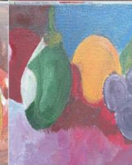
Manualidades AFA Lepe