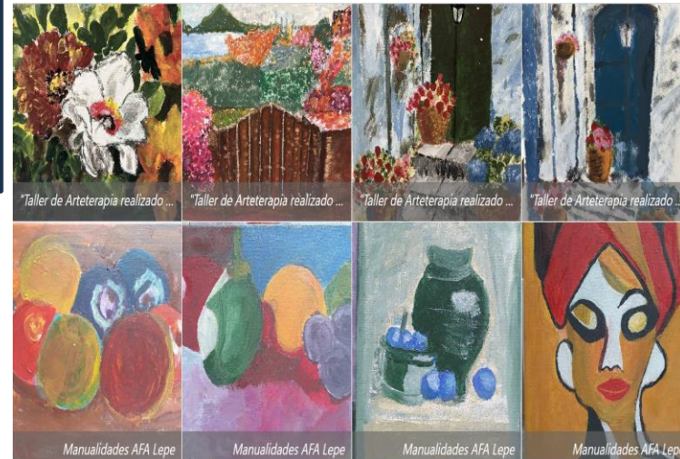
Taller de Arteterapia realizado ...