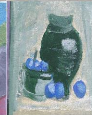
Manualidades AFA Lepe