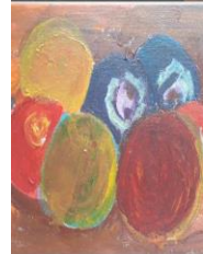
Manualidades AFA Lepe