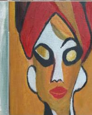
Manualidades AFA Lepe